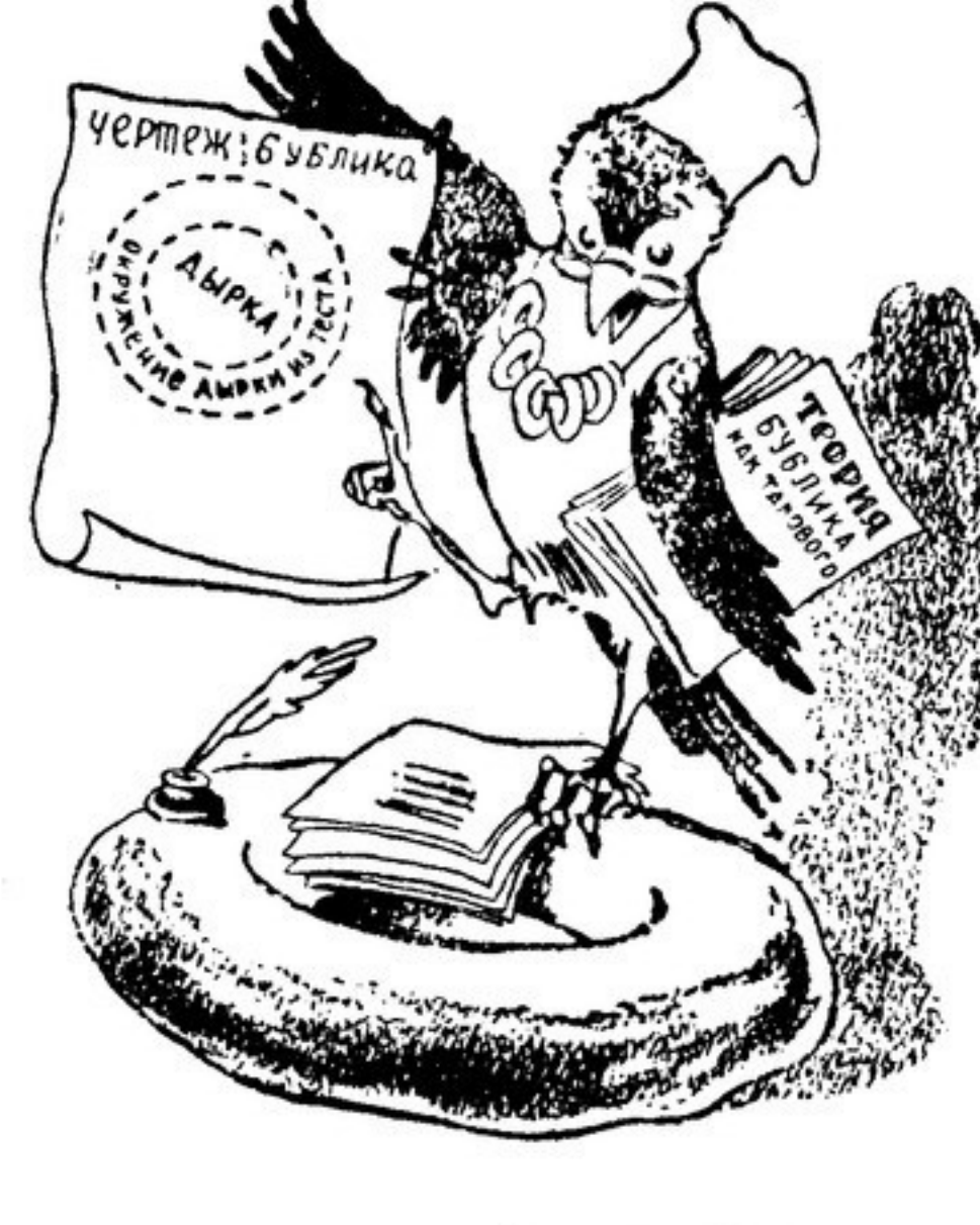
Рис. В. ФОМИЧЕВА

Вот, говорят, читатель-друг, Стрелась какое приключенье: Когда-то Чижик кем-то вдарил Был брошен на хлебопеченье. Сперва он очень был смущен: Труд этот был ему неведом. Но два-три дня прошло, и он Велущим стал бубликоведом. А дней, примерно, через пять Напыжась, начал заявлять, Что в наши дни, Для нашей публики Нужны совсем другие бублики. Что в бублике мука и соль Играют мизерную роль, Что дырка, как пустое место, Важнее в бублике, чем тесто. Потом он срочно сел за стол И вмиг под бубликом подвел Теоретическую базу Их не отдавши ни разу. Но, чтобы избежать придиризм, Теперь, наверно, поведет Борьбу за бублики без дырок... Чиж взят за это в оборот.